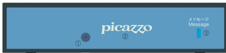
① 赤外線受光部 ② 電源確認 LED ③ メッセージ LED